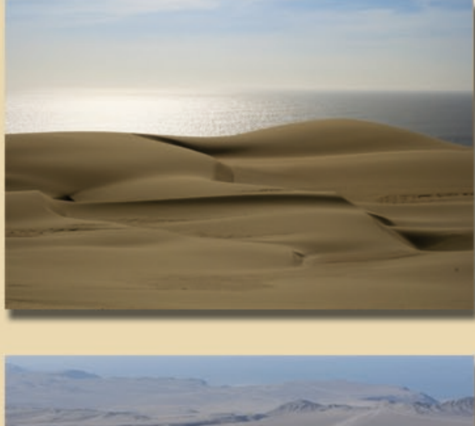
TABLEAU DU DAKAR 2013... LE QUADRIPTYQUE