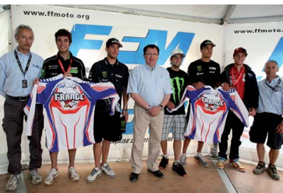
Présentation du maillot officiel pour le MX des Nations lors du Grand Prix de France à Saint-Jean d'Angély en présence du Président de la FFM, Jacques Bolle.