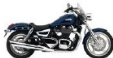
Pas d'insectes sur vous.