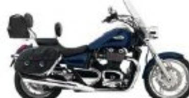
La votre en bleue.

Façonnez-la comme bon vous semble. Personnalisez votre Triumph en allant sur CREATE MY TRIUMPH, ou en rendant visite à votre concessionnaire local. Cet outil de configuration perfectionné vous permet de choisir n'importe quelle Triumph, dans n'importe quelle couleur produite, et de la voir se transformer à mesure que vous lui ajoutez autant d'accessoires que vous le souhaitez.