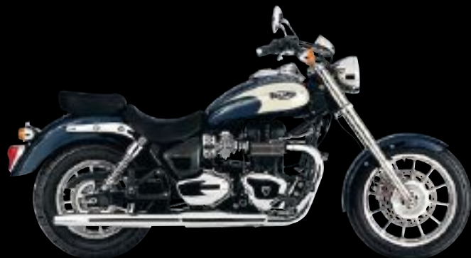
PACIFIC BLUE / NEW ENGLAND WHITE