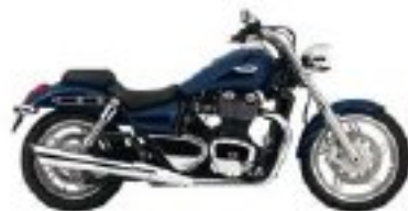
Ou vous la préférez bleue ?