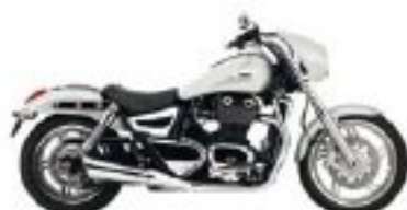
Moi je l'aime comme ça.