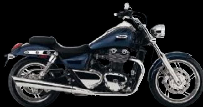
PACIFIC BLUE WITH FUSION WHITE STRIPE (BLEU À RAYURE BLANCHE)

2 ANS PIECES ET MAINS D'OEUVRE KILOMÉTRAGE ILLIMITÉ G A R A N T I E