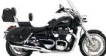
Allez, on y va.