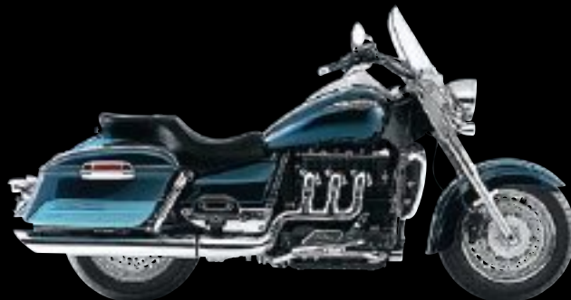
ECLIPSE / AZURE BLUE