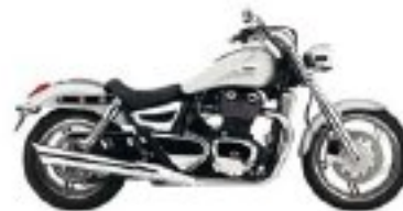
Ajoutons du chrome.