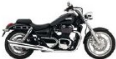
Je la choisie Noire.