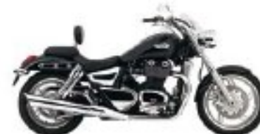
Détendez vous et profitez.