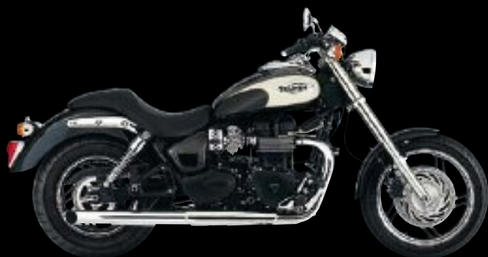
PHANTOM BLACK / NEW ENGLAND WHITE

2 ANS PIECES ET MAINS D'OEUVRE KILOMÉTRAGE ILLIMITÉ G A R A N T I E