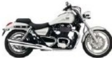
Vous la préférez en « silver » ?