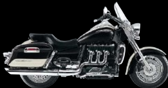
JET BLACK / NEW ENGLAND WHITE

2 ANS PIECES ET MAINS D'OEUVRE KILOMÉTRAGE ILLIMITÉ G A R A N T I E