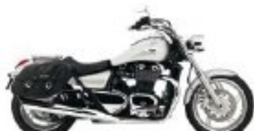
Vous, la moto et la route, rien d'autre.